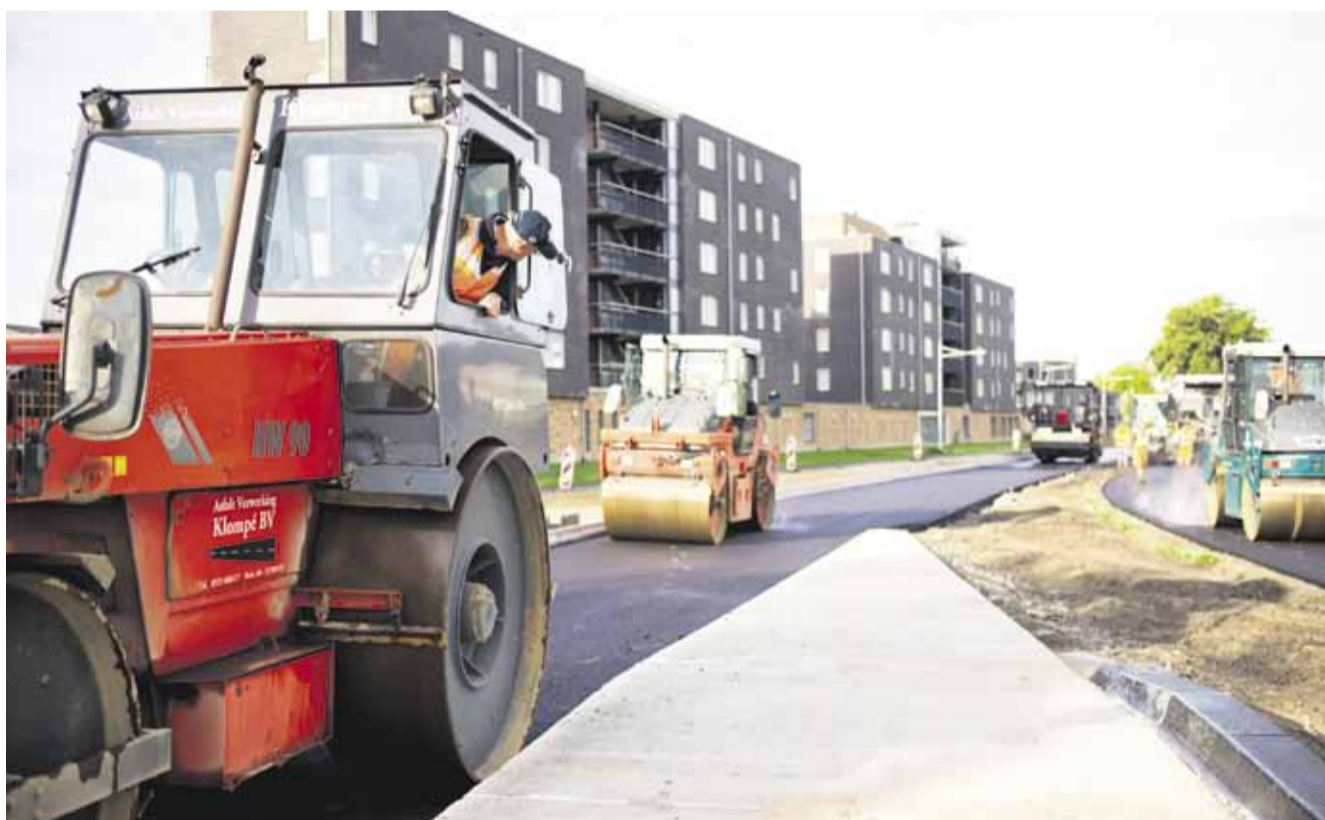
De gemeente Assen schrijft Past Performance voor, zodat aannemers weten waar ze aan toe zijn.