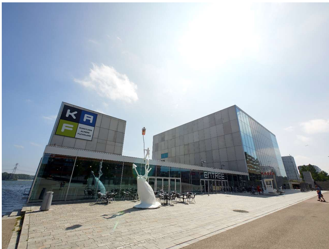
Kunstlinie Almere Flevoland , congreslocatie NCBOR 2018

Ook als sponsor dient u zich gewoon aan te melden via de website van het congres www.ncbor.nl . Tijdens de inschrijfprocedure vindt u dan aan dat u sponsor bent. Dat geldt ook voor u collega's. De gratis toegangskaart en het speciale kortingstarief van € 350,00 per persoon voor uw collega's worden dan toegepast.