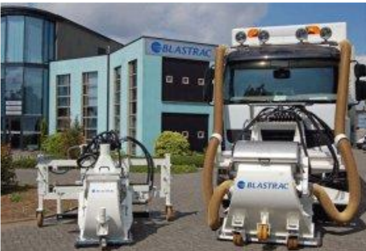
Foto 1 Blastrac 2-45DTM

Het betreft de Blastrac 2-45DTM (zie Foto 1). Dit systeem bestaat uit een straaleenheid die aan de voorzijde van een vrachtwagen wordt gemonteerd. De straaleenheid wordt met vier hydraulische en één elektrische aansluiting verbonden met de vrachtwagen. Twee luchtslangen zorgen voor de aanvoer van de kogeltjes en de afvoer van het opgezogen verwijderde oppervlakte materiaal. Door gebruik te maken van een magneet in het straalhuis worden de stalen kogeltjes gescheiden van het oppervlakte materiaal en kunnen zodoende hergebruikt worden. Bediening vindt plaats vanuit de cabine van de vrachtwagen.