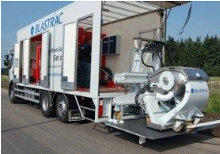
Foto 2 Straaleenheid achter in vrachtwagen

De maximale breedte die in één gang behandeld kan worden is 1150 mm. Het gewicht van de straaleenheid bedraagt 1750 kg. De straaleenheid kan in de breedte van de vrachtwagen verschoven worden om zo een volledige rijstrook te kunnen behandelen. De snelheid kan variëren tussen 0,5 en 40 m/min.